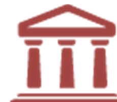
Camera di Commercio